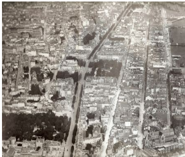
avant les bombes