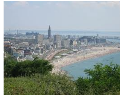
le havre de paix