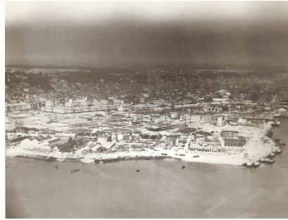
après les bombes